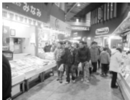
久喜市商工会青年部視察