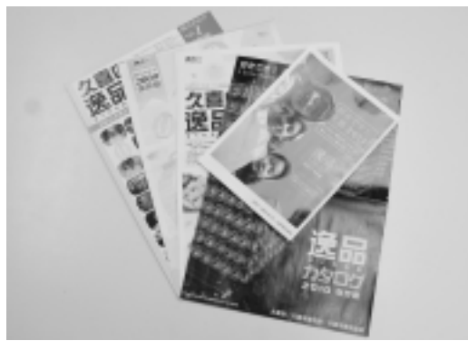
▲2007年版～2011年版の逸品カタログ

2012年版久喜の逸品 「好きです!久喜!!」 カタログ4月中旬に発行決定! どうぞ、ご利用ください!