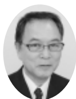
『経営革新計画』認定企業を訪ねて 株式会社ポ・ポ

「不透明な今の時代にどう対処したらよいか悩んでいましたが、経営革新計画を受ける事により明確にできるのではないかと、これは良い機会と思いつける事にしました」 「今回、経営革新を受けるに当たり、もう一度原点に返って事業を見直す事が出来ました。それによって、経営理念に基づいた接客が出来ていなかった事に気が付きました。経営理念の『美の創造集団』として、単に商品売るだけでなく、お客様にエキスポイト提案をしていかなければと考えました。お客様に美しさをどう提供出来るか考え、これまでのファンデーションや口红等を肌塗布するブラスの美しさから発想の転換を図り、本来の美しさから追求するマイナスの美学洗顔をクレンジング・シャンプー・マツサージ等の技術を含めた取り除く美容を提案し、実際にお客様に実践して行く。それが今