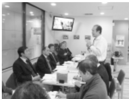
久喜市商工会商業部会視察

▲2/7(火)『街のお助け隊コンサルジュ』について説明を受ける一行。東京都品川区中延(なかのぶ)商店街