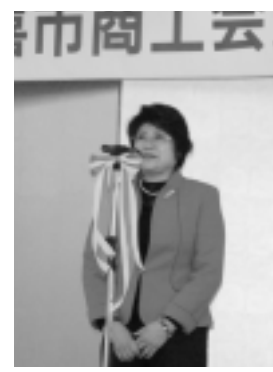
▲西谷女性部長の新年の挨拶

久喜市商工会女性部の新春祝賀会が、来賓の方々をお迎えしホテル久喜で開催されました。今回は新久喜市が誕生して初めての祝賀会である他、四間道路高架橋が3月26日に開通する事や4月1日に総合病院がオープンする事等、明るい話題の祝辞が寄せられました。また、女性部の4名の方が女性部功労者として表彰された報告と、新たに5名の方が入部した事から、その紹介がありました。さらに、女性部部長による舞いの披露があり、女性部の祝賀会らしい華やかな会となりました。