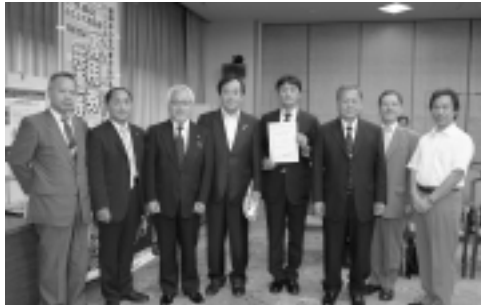
▲「商店街版経営革新計画」認定式にて

久喜市商工会青年部は、お陰様で創立30周年を迎える事となりました。そこで、ご支援いただいた地域の皆様へ感謝をお伝えするため『くき市(いち)』を開催致します。くき市(いち)は、久喜駅西口を始点・終点とする『JR「駅からハイキング」』の開催に合わせ一番街商店会を歩行者天国とし、軽トラックの荷台やテント内で新鮮な野菜、果物、飲食、珍しい工芸品等の販売を行います。また、皆様楽しんで頂けるよう、大抽選会・全長8メートルの巨大恐竜ショーが行われます。