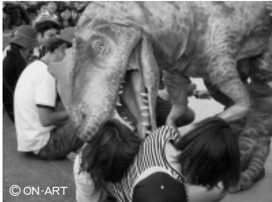
▲僕らの街へ恐竜がやって来る!!

日時：11月27日(土) 10時～15時 ※小雨決行 場所：一番街商店会及び埼玉りそな駐車場 主催：久喜市商工会青年部 久喜市久喜中央4-7-20 TEL：0480-21-1154