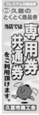
▲加盟店(取扱店) こののぼりのお店でご利用頂けます。