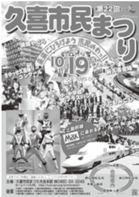
▲久喜市民まつりポスター

※お問合せ：久喜市民まつりの会 TEL：24-2249 URL http://kuki.jpn.org/main/siminmaturi/ 右記の▶ QRコードでもアクセスできます