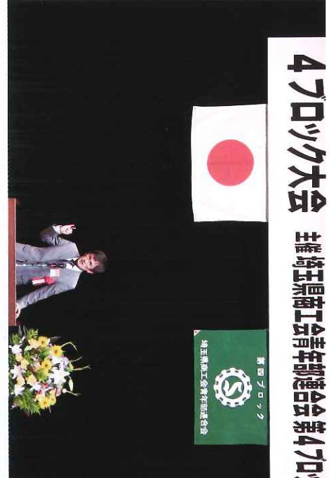
4ブロック大会 主催埼玉県商工会青年部連合会第4ブロック