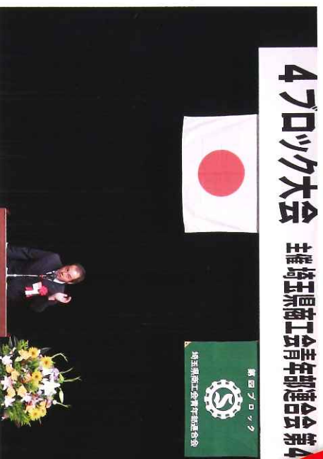
4ブロック大会 主催埼玉県商工会青年部連合会第4