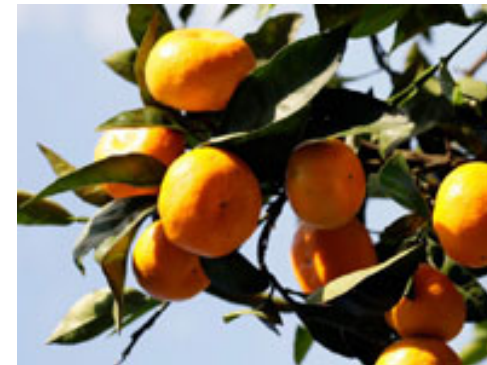
小坂みかん共同農園にて「みかん狩り」