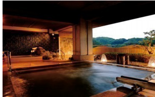
静岡県・伊豆長岡温泉 ホテル天坊のお風呂