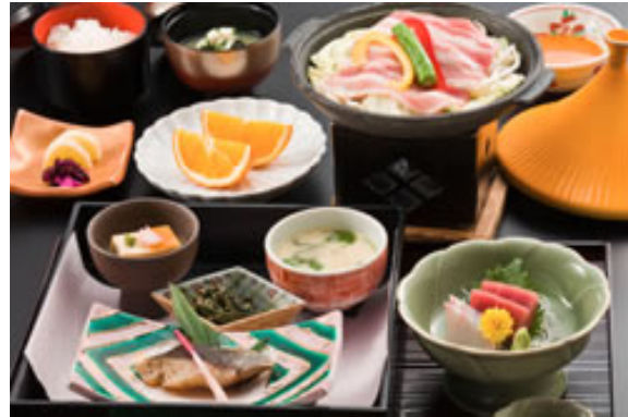
伊豆味づくし ホテル天坊のお食事

今回も、前回同様、出発場所が4箇所になります。参加申込状況によって内容等に多少変更が生じることがありますが、ご了承頂きたくお願いします。