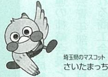
埼玉県のマスコット さいたまっちゃん