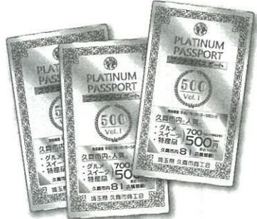
一店舗の利用は3回までとなっている

商工会職員が店舗や食事、商品の写真撮影から、地図や掲載原稿の編集までこなし完成させた。商工会では、「これを機会に、ぜひ地元のあるようなお店で食事や買い物をしてもらい、地域活性化につながれば」と話している。