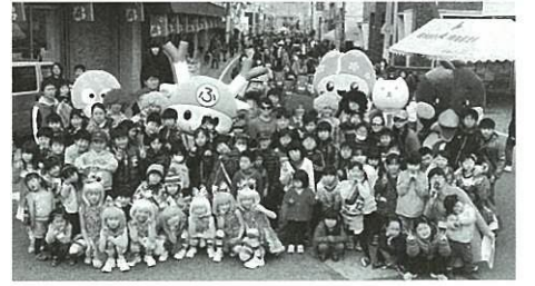
《昼の部》にてご当地キャラと記念写真

商工会では「今回のイベントは、青年部を中心とした若手経営者と若手役職職員で企画した。やる気のある若者が出てきて大変嬉しい。継続的に実施していきたい」と話している。