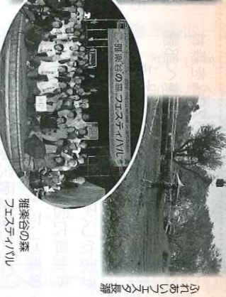
彩の国商工会だより

掲載情報は9月20日現在のもので、変更になる場合もありますので、お出かけの前に必ずご確認ください。