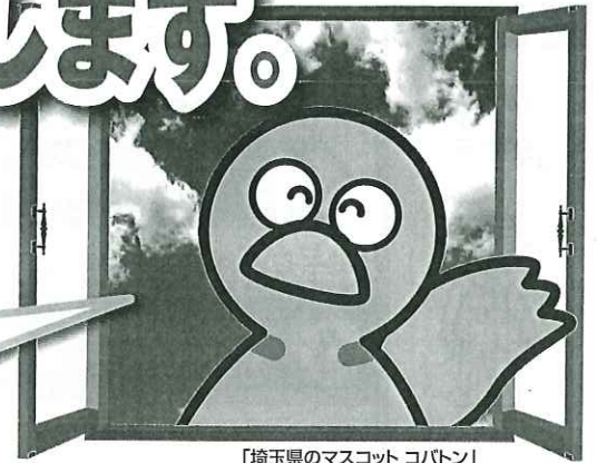
「埼玉県のマスコット コバトン」

平成27年度に個人住民税の特別徴収未実施の事業所を 原則として特別徴収義務者に指定します。