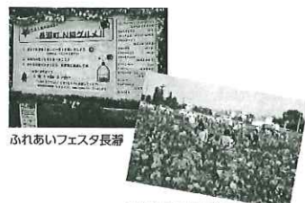
ふれあいフェスタ長瀬