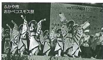
ふかや市 おがべコスモス祭