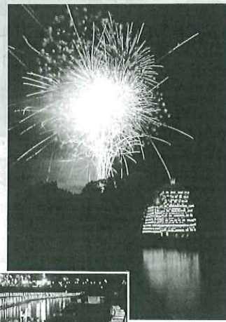
長瀬町 船玉まつり