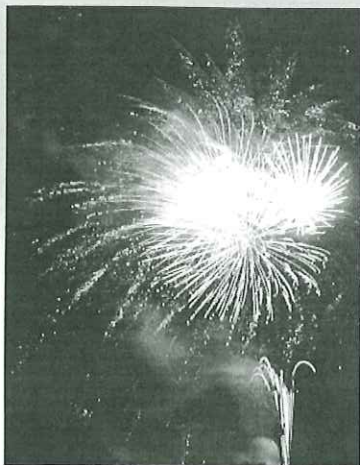
毛呂山町 サマーフェスティバルもろやま