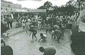
皆野町 ころしよカーニバル