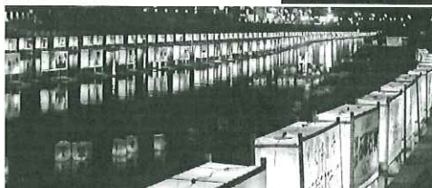
杉戸町 古利根川流灯まつり

掲載情報は6月20日現在のものです。 変更になる場合もありますので、 お出かけの前に必ずご確認ください。