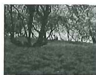
日高市 巾着田曼珠沙華まつり