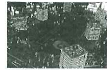
久喜提燈祭り(天王様)