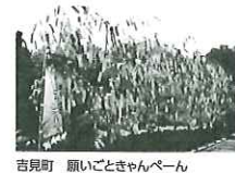
吉見町 願いごときゃんぺーん