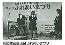
朝霞駅前商店会ふれあいまつり