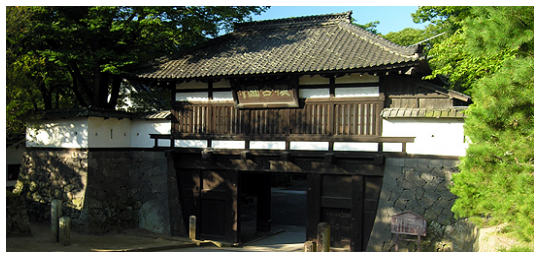
小諸城址懐古園（大手門）

見学あり温泉ありと楽しみ満載の旅です。まず、日本城郭建築初期の代表格といわれる大手門のある懐古園で散策をお楽しみ頂き、次に、葡萄畑に囲まれたマンズワイン小諸ワイナリーを見学。戸倉上山田温泉の千曲館の源泉かけ流し温泉で日頃の疲れを癒し、おいしいお食事をお楽しみ頂きます。さらに秋の味覚、甘さ極めつけ、もぎたてのおいしさ実感、信州りんご狩りをご堪能頂きます。従業員の皆様には知的好奇心と癒しの旅へのご参加を心よりお待ちしております。