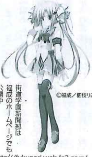
街道学園新聞部は、福成のホームページでも公開中 http://fukunari.web.fc2.com/

商工会では、「キャラを活用したスタンラリーなど商店街を回遊させる仕組みをつくり、商店街活性化にうまく繋げたい」と話している。