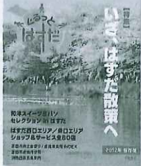
ABサイズ36ページのフルカラー 蓮田市商工会等で配布中