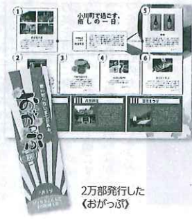
2万部発行した《おがっぶ》

小川町商工会は、立教大学生と産学協働で小川町マップ《おがっぶ》君の知らないまちがある》を制作した。地域資源を活用し《小川町らしさ》にこだわ