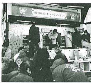
復興応援トラックマーケットホームページ http://www.one-heart-now.jp/

当日は、様々な特産品が所狭しと会場に並び、「復興への一助に」と支援の気持ちを寄せる多くの人で賑わった。この他、埼玉県内ではJR川口駅前公共広場でも開催された。イベントの様子はホームページで見ることが出来る。