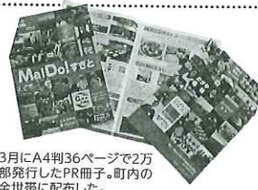
3月にA4判36ページで2万部発行したPR冊子。町内の全世帯に配布した。

また、商店ゼミは《杉戸商人塾》と題して、商売をより多くの人に知ってもらおうと、町内の商店主が講師となって各々の専門的な知識・コツを伝授する講座を開催。《お酒の選び方》《洋菓