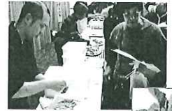
《のらぼう菜》アブラナ科野菜の一種。栄養価が高く、天明・天保の飢饉の時、住人の命を救ったと言われている。

嵐山町、小川町、ときがわ町では、地域農業者、農業生産者が一体となり、江戸時代から比企地域で作られる伝統野菜《のらぼう菜》を活かした魅力ある商品づくりに取り組んでいる。3町の商工会は、3月9日、のらぼう菜の良さを知ってもらおうと一般消費者等を対象とした《のらぼう菜農商工連携サミット》を(リリックおがわ)にて開催した。