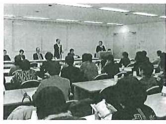
商工会女性部長会議の様子

県商工会女性部連合会は、3月6日、さいたま市内において42名の参加のもと商工会女性部長会議およびリーダー研修会を開催した。女性部長会議では、平成23年度の県女性連事業の報告と各ブロック管内での広域連携事業について報告があり、続いて、各ブロック代表者による各地域の活動事例発表が行われた。最後に、平成24年度県女性連事業計画「骨子」をもとに地域