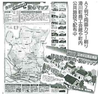
A2判で両面カラー刷り 滑川町商工会館や町内 公共施設で配布中

滑川町商工会では、防災意識を高めてもらうこと、地域の建設業者の利用促進を目的として「いざというときの建設業者案内安心マップ」を作成した。同マップでは、一般建築、塗装工事といった8区分で色分けされた専門技術を持つ25会員事業所の所在地を示し、