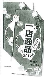
参加店や市内の公共施設等で配布中

また関連して、逸品のお店を巡るツアーを企画・開催し、参加者からは「地元のお店なのに意外と知らない部分を新しく発見できた」と好評を得たという。羽生市商工会では「逸品カタログを参考にして店に立ち寄りつてもらい、大型店とは違った魅力を見つけてほしい」と話している。