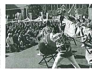
和光太鼓の迫力ある演奏などステージイベントも行われ会場を盛り上げた

和光市商工会は、県内外から特色ある鍋を持ち寄って味を競い合う日本最大級の鍋料理コンテスト(第8回ニッポン全国鍋合戦)を1月29日、和光市役所の市民広場で開催した。44チームが参戦し、来場者は個性豊かな鍋を堪能した。