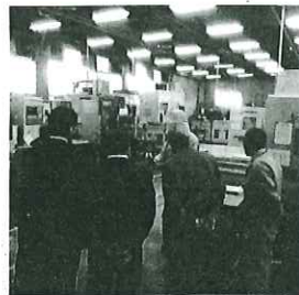
参加者は視察を通じ、同校の取組みを実感

桶川市商工会 ☎048(786)0903 伊奈町商工会 ☎048(722)3751