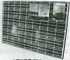
太陽光発電パネル

上里町にある(有限)いらプロパンは、昭和32年の創業で(お客様と距離の近い、顔の見える商売)を心がけ、石油製品やプロパンガスの販売といった燃料小売業を営んでいる。 2代目の入氏は、今後の事業展望について思いめぐらした時に、環境に優しいエネルギー分野への進出が必須であると考え、太陽光パネル販売や電気工