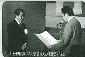
上田知事より感謝状が贈られた