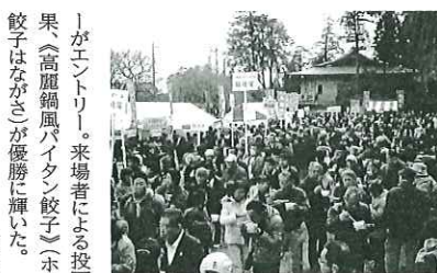
来場者は多彩な高麗鍋メニューを楽しんだ

●第4回高麗鍋コンテスト 日高市商工会 ☎042(985)2311 日高市商工会は、2月5日に高麗神社で(第4回高麗鍋コンテスト)を実施した。 高麗鍋は「キムチ味」「地場産野菜使用」「高麗人参使用」の3つが必須条件。それらを満たし、かつ独創的なアイデアで作られた15チームの高麗鍋メニューがエントリー。来場者による投票の結果、「高麗鍋風パイタン餃子」ホワイト餃子はながさが優勝に輝いた。